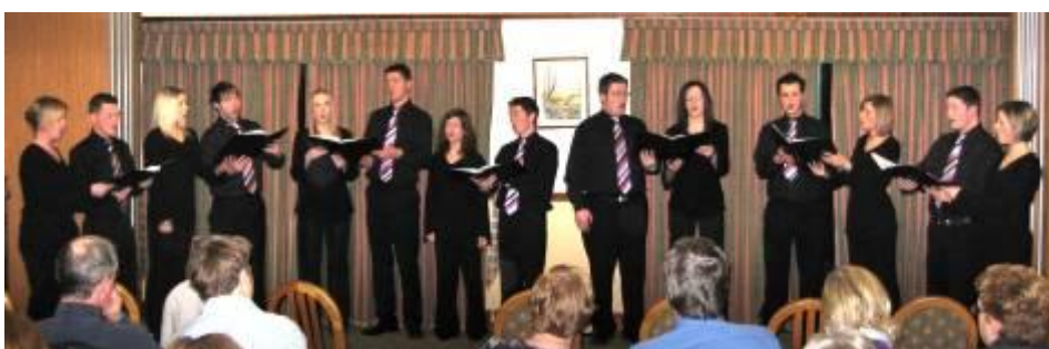
Cytgan yng Nghlwb Golf Llanisien