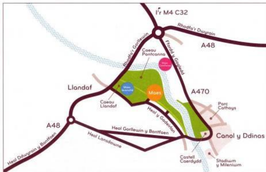
Cynhelir yr Eisteddfod yn ysblander caeau Pontcanna yng nghanol Caerdydd

Cynhaliwyd nifer o gyfarfodydd cyhoeddus yn ystod yr wythnosau diwethaf a daw cyfnod yr ymgynghoriad i ben ar 14 Mawrth 2008 felly prin ddyddiau sydd ar ôl i rieni a darpar rieni bwysu i gael addysg cyfrwng Cymraeg teilwng i'w plant. Gallwch ddatgan eich barn ar y cynllun drwy e-bost i: hyjones@caerdydd.gov.uk .