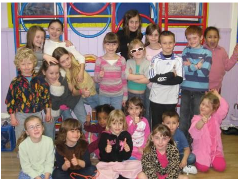
Hwyl yn y Cynllun Gofal