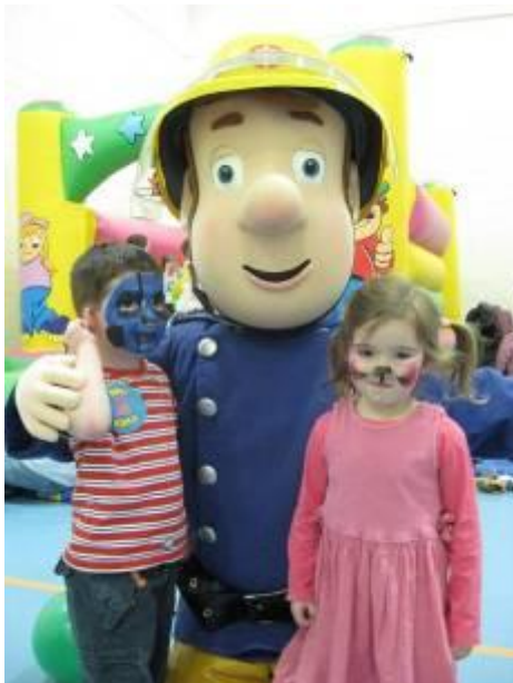
Hwyl Miri Meithrin

Mae'r bore coffi wythnosol Coffi a Chlonc yn parhau bob Dydd Mercher rhwng 12pm a 1pm yn Bar One (lan lofft) yng Nghanolfan y Mileniwm. Mae'r sesiwn yn addas i Ddysgwyr o bob safon.