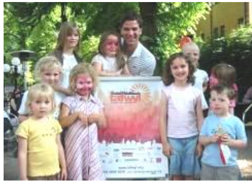
Gethin Jones, cyflwynydd Blue Peter, agorodd yr Ŵyl yn swyddogol yn y Ffair.