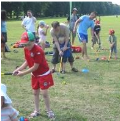
Gweithdy Chwaraeon ar Gaeau Pontcanna