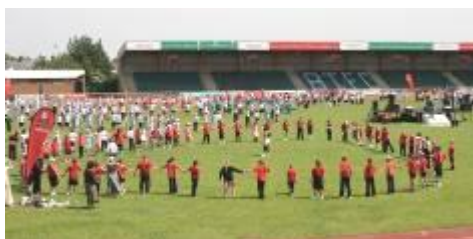
Twmpath enfawr ym Mharc Jenner