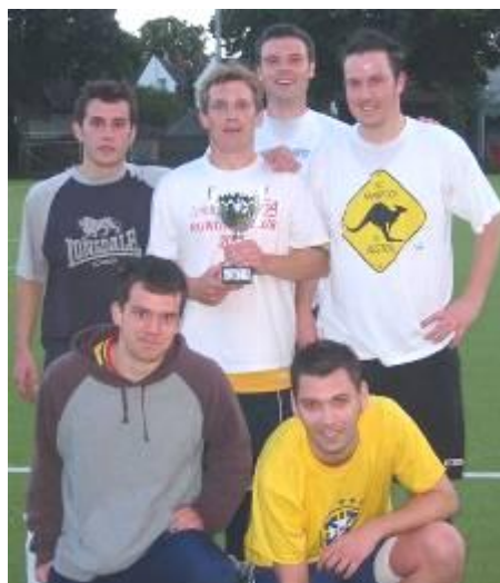
CNL : Tîm Buddugol Cystadleuaeth 5 Bob Ochr yr Ŵyl