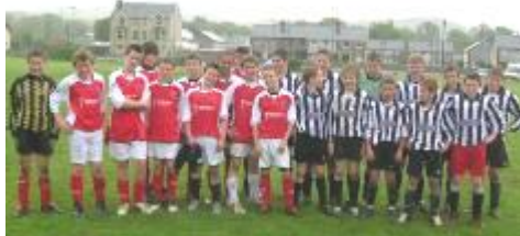
Tîm pêl-droed dan 13