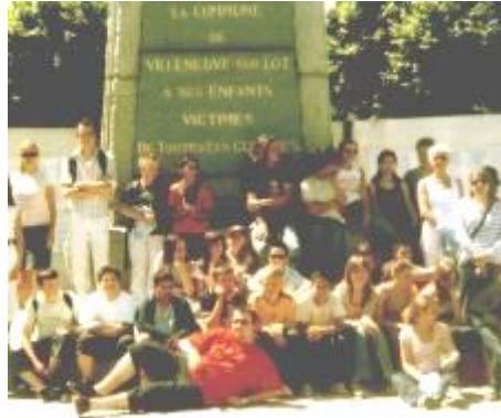
Staff a disgyblion Ysgol Plasmawr yng nghwmni gwsteiwyr Castelmoron sur-Lot