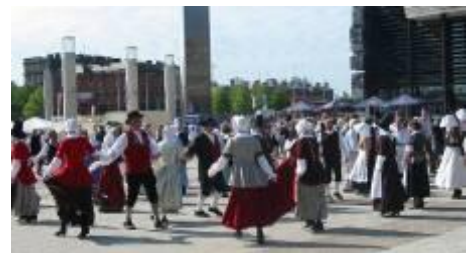
Daeth cannoedd o ddawnswyr ynghyd yn y Bae brynhawn Sadwrn yn ystod Gŵyl Ifan