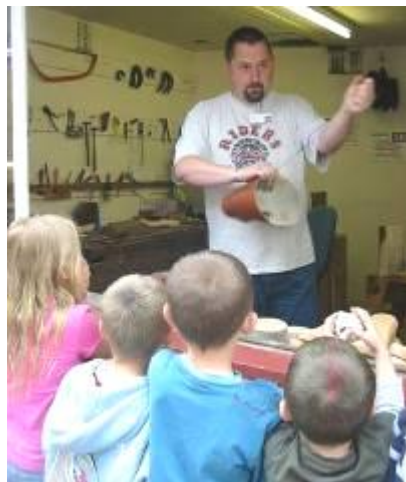
Gweithdy Clocio yn Sain Ffagan