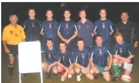
STYDS – Enillywr Cystadleuaeth Rygbi 'Touch' Tafwyl