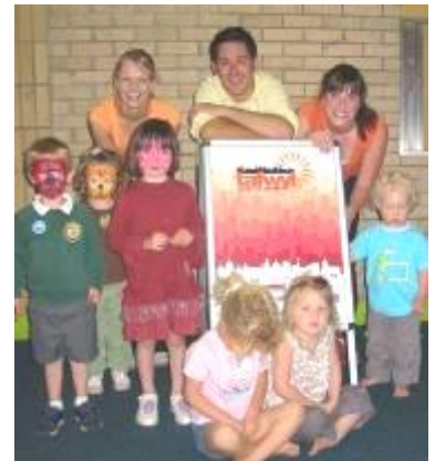
Triogel yn Hwyl yr Ŵyl