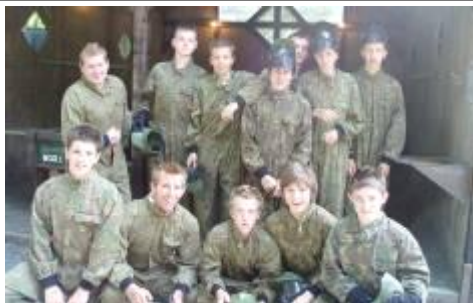
Tîm pêl-droed dan 14

Bydd sesiynau pêl-droed yn aildechrau ar ddydd Sadwrn cyntaf mis Medi o 9am -10am ar gaeau Llandaf. Croeso i blant sy'n mynychu ysgolion Cynradd Cymraeg Caerdydd. Yr Urdd yw'r unig dîm pêl-droed Cymraeg i blant yn y brifddinas, gyda 10 tîm yn chwarae yng nghynghrair Caerdydd a'r Fro bob bore dydd Sadwrn. Bydd tîm newydd dan 8 (blwyddyn 3 o fis Medi 06) yn cael ei ddewis yn ystod mis Medi er mwyn cychwyn yn y gynghrair fis Hydref. Bydd y tîm newydd yn ymarfer bob nos Fawrth ar gae astro Tal-y-bont rhwng 5 a 6. Am fwy o wybodaeth am Glwb Pêl-droed yr Urdd Caerdydd, cysylltwch gyda James Rhys Williams ar 02920 635684